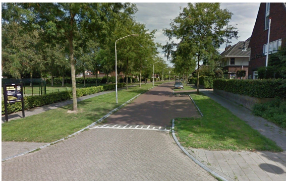
Figuur 1 Huidig straatbeeld

Daarnaast komt uit de gesprekken met de bewoners naar voren dat Sportpark een kinderrijke buurt is en dat er om die reden meer aandacht geschonken mag worden aan de speeltuinen; deze mogen meer met de tijd meegaan en uitdagender worden voor de kinderen. Hierbij bevelen de studenten aan om gebruik te maken van de Schijf van Vijf voor buitenspelen. Deze richt zich op traditionele speeltuinen, natuurlijke speelplekken, pleintjes, trapvelden en speelroutes.